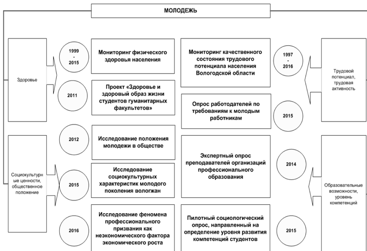
Рис. 1. Эмпирическая база исследования молодежи в ВолНЦ РАН